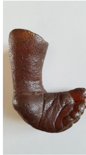
Modèle en Latex initial

L'apprentissage des pathologies du pied du nouveau-né est difficile pour les étudiants en kinésithérapie. Les modèles de pied bot en latex existants correspondent aux besoins généraux de l'enseignement mais manquent de réalisme et de cohérence avec le Sim New Baby. Un projet a été élaboré pour : 1) Réaliser des pieds améliorant le réalisme (adaptation sur le mannequin de nouveau-né) ; 2) Evaluer le bénéfice potentiel dans l'apprentissage procédural réalisé au cours de séances de simulation.