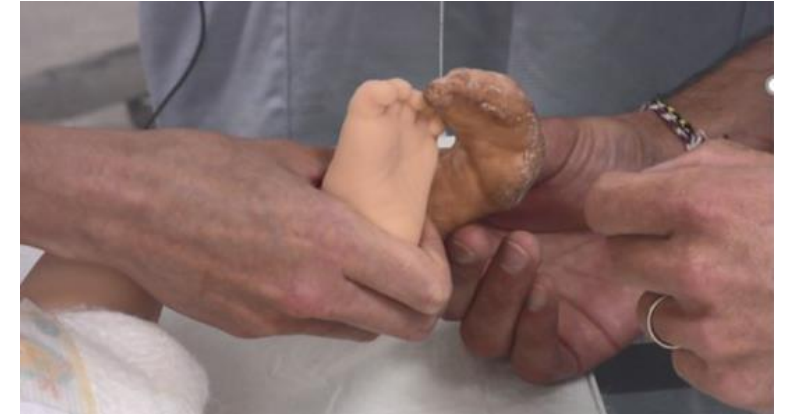
Comparaison pied du Sim New Baby avec pied en latex