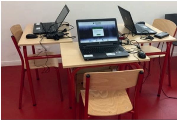
FIG. 1. Organisation du placement des ordinateurs pour une séance de serious games .

avec la société partenaire, Synakène. Le thème retenu est celui de l'accueil d'un patient en chirurgie ambulatoire. L'originalité de la conception tient dans le fait que ce sont des étudiants en soins infirmiers de troisième année qui élaborent le scénario. Les formateurs accompagnent ce processus de conception. Par ailleurs, ceux-ci se portent garants de la qualité des données probantes utilisées par les étudiants (3) .