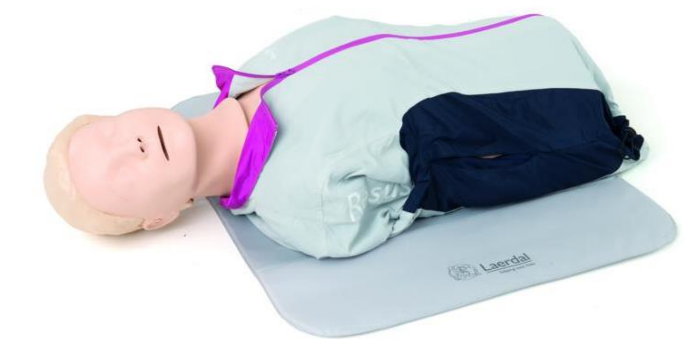
Mannequin Resusci Anne, Laerdal®