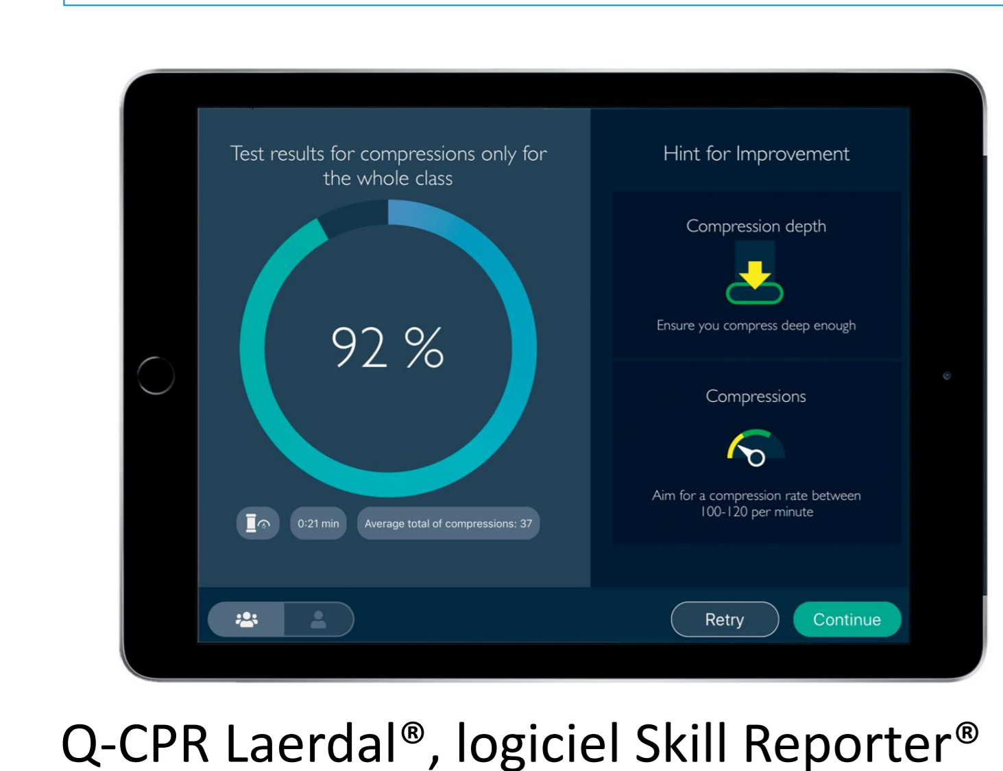
Q-CPR Laerdal®, logiciel Skill Reporter®

Contexte et objectif Formation aux gestes de secours et d'urgences (FGSU) obligatoire dans les études de médecine. Une grille d'observation (GO) permet d'accroître l'attention et favoriserait la mémorisation et la performance. Évaluer l'intérêt de l'utilisation d'une GO pour améliorer l'apprentissage des étudiants en médecine lors d'une formation sur la gestion de l'arrêt cardiaque