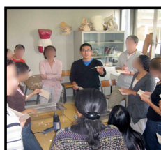
Exposé technique : Thermoformage d'Orthèses de main

Tous les Travaux Pratiques et une grande partie des Enseignements Dirigés sont proposés en DEMI GROUPE