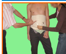
Essayage de ceinture sur mesure