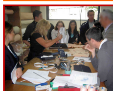
Visites d'ateliers de fabrication